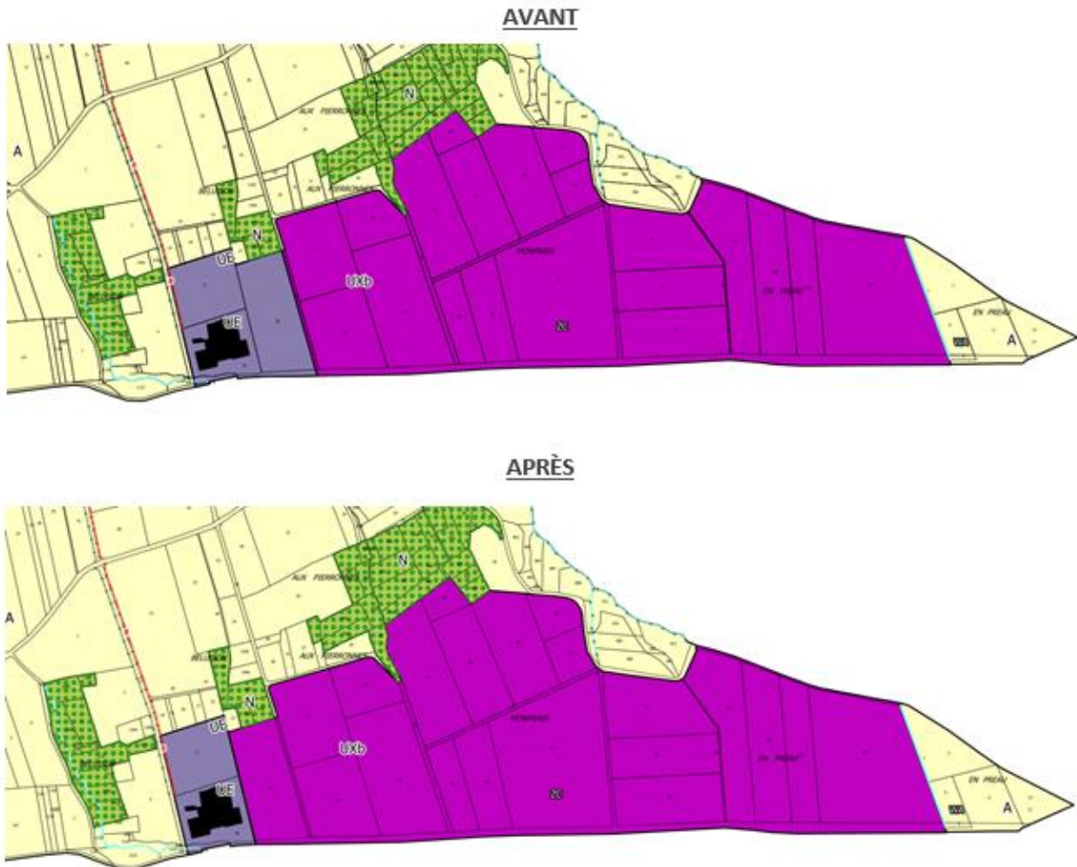
Figure 1. Reclassement parcelle ZC78 de UE (équipements) vers UXb' (activités économiques)